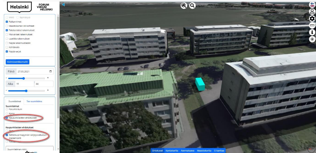
Kuva 3. Kontin sijoituspaikka.

Maisemoitavan kontin sijainti osoitteessa Katajaharjuntie 17, Lauttasaari, Helsinki. Sähkökuormapyörien sisäänkäynti tulee kontin eteläpuoleiselle pitkälle sivulle. Maisemoitavana ovat rakennelman tasakatto, itäsivu, länsisivu ja pohjoissivu. Sijoituspaikan koordinaatit WGS84 koordinaatistossa ovat 60.166915, 24.858403.