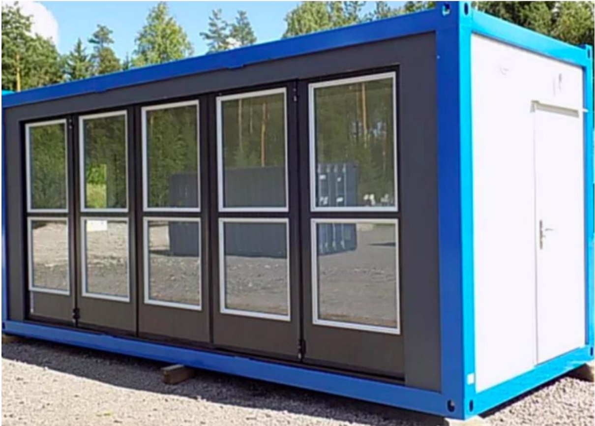
Kuva 1. Kuva maisemoitavasta kontista.

Maisemoitava kohde on noin 6 metriä pitkä, 2,4 metriä leveä ja 2,8 metriä korkea kontti. Kuvassa näkyvä kontin pitkä sivu toimii sähkökuormapyörien ovena, jonka käyttöä maisemoinnin ei tule rajoittaa. Vastaava sivu kontin toisella puolella on maisemoitavissa. Myöskään kuvassa näkyvää toisen lyhyen sivun huolto-oven käyttöä ei tule rajoittaa.