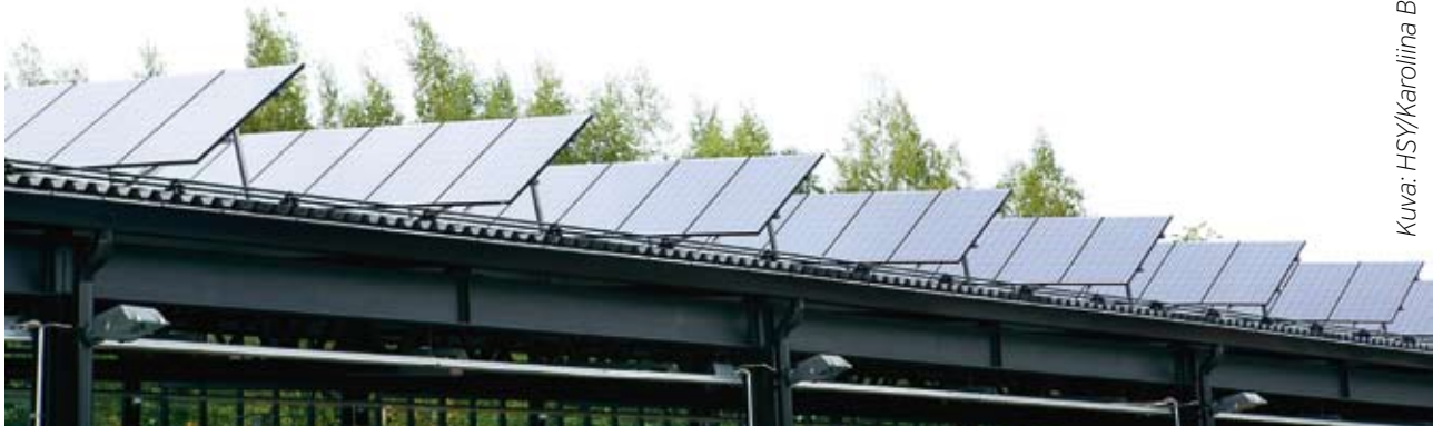
Espooseen Mankaalle on asennettu aurinkopaneeleita varikkorakennuksen katolle. Järjestelmä tuottaa sähköä noin 45 000 kWh vuodessa.

Pääkaupunkiseudun ilmastonmuutokseen sopeutumisen taustaraportti valmistui toukokuussa. Työ on osa HSY:n ja pääkaupunkiseudun kaupunkien yhteistä ilmastonmuutoksen sopeutumisstrategiatyötä, jota tehdään Julia 2030 ja BaltCICA EU-hankkeissa. Pääkaupunkiseudun sopeutumisstrategia on sekä alueellinen että kaupunkien yhteinen. Se keskittyy kaupunkiympäristöön ja rakennettuun ympäristöön. Keskeistä työssä on riskien tunnistaminen ja hallinta. Myös ilmastonmuutoksen vaikutusten ja sopeutumisen kustannuksia seudulla arvioidaan. Sopeutumisstrategia valmistuu vuoden 2011 lopulla.