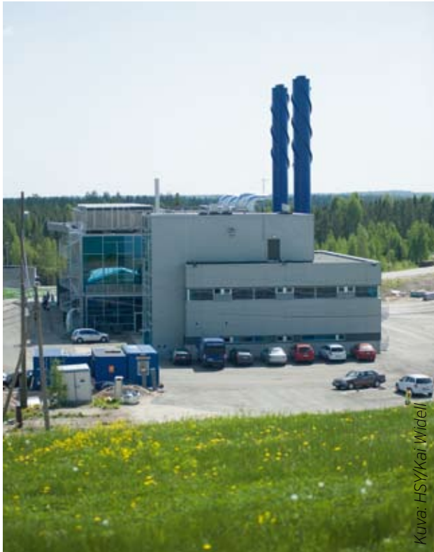
HSY:n kaasuvoimala vihittiin Ämmäsuolla käyttöön toukokuussa. Kaasuvoimala hyödyntää kaiken vanhalla ja uudella kaatopaikalla kerättävän kaatopaikkakaasun.

Helsingin Energia, Helen Sähköverkko, ABB ja Nokia Siemens Networks allekirjoittivat toukokuussa aiesopimuksen teknologiayhteistyöstä tulevaisuuden älykkäiden energiaratkaisujen kehittämiseksi ja testaamiseksi Kalasataman alueella. Tavoitteena on maailmanlaajuisesti merkittävä älykkään sähköverkon mallialue, jossa uusinta energia-, informaatio- ja viestintäteknologiaa yhdistämällä luodaan kestävä kehityksen mukainen energijärjestelmä palveluineen myös muualla edelleen sovellettavaksi. Älykäs energijärjestelmä sisältää muun muassa paikallisen uusiutuvan sähköntuotannon, kuten aurinko- ja tuulivoiman, sähköautoilua tukevan infrastruktuurin ja sähkön varastoinnin sekä kotien ja liikerakennusten energiatehokkaan kiinteistöautomaation. Uusien palvelujen avulla sähkönkulutusta voi ohjata automaatiolla aikoihin, jolloin esimerkiksi tuulee ja tuulienergiaa on tarjolla ja toisaalta välttää käyttöä pörssisähkön hintapiikkien aikana.